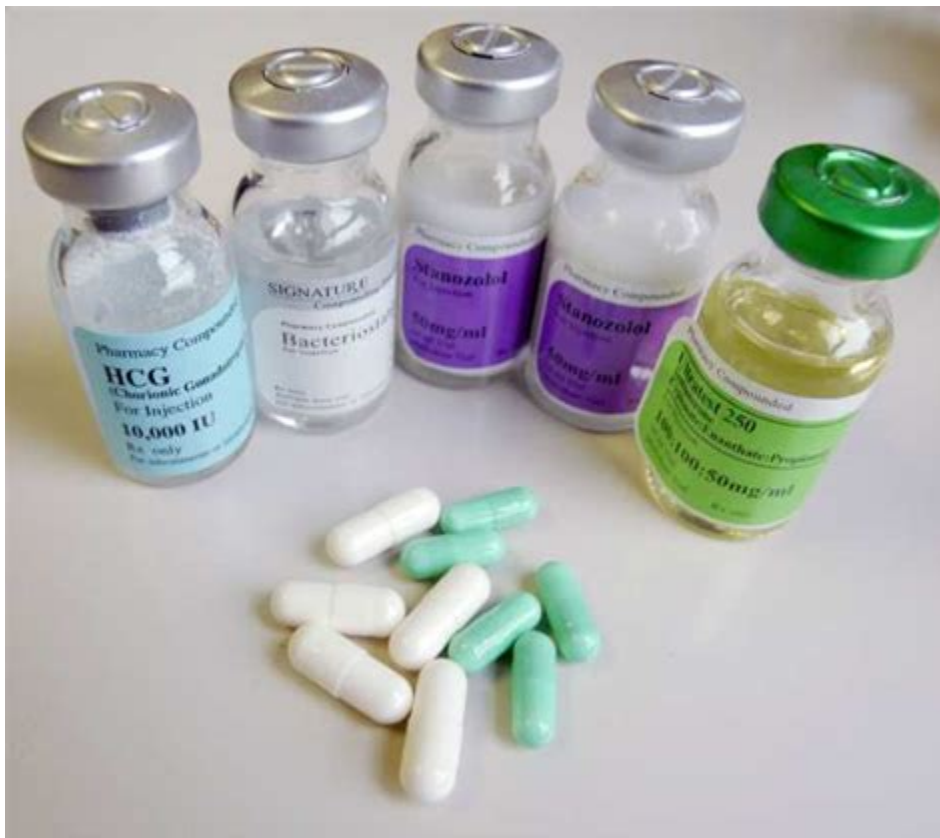
Dianabol in der Schweiz

Drachensang Schweiz hier erhalten Sie alle Produkte wie Danabol, Nandrolon und Primobolan zum kaufen für maximalen Muskelaufbau, Kraftzuwachs und Definitionsphase.. Boldobol, Clen, Danabol, Nandro 200, Oral T-Bol, Oxandro, Primobol 100, Susta Mix 250, Testo Depot 250, Testobol Prop 100, Tren 100, Tren Enant 150, Winny 50, Tetrasterone.. Boldobol, Clen, Danabol, Nandro 200, Oral T-Bol, Oxandro, Primobol 100, Susta Mix 250, Testo Depot 250, Testobol Prop 100, Tren 100, Tren Enant 150, Winny 50, Tetrasterone.. Wegen der aktuellen Lage ist der Versand für die. Danabol 5 mg Dianabol bekannteste Produkten Muskelmasse und Kraftzuwachs Danabol